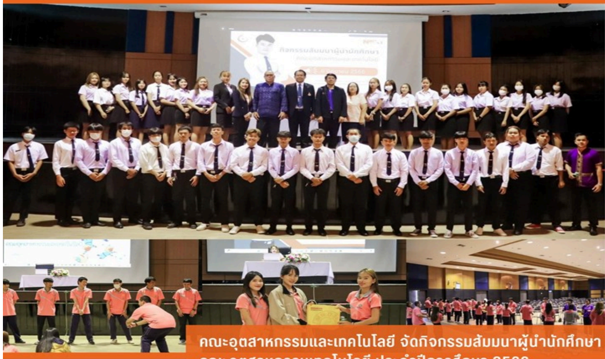
คณะอุตสาหกรรมและเทคโนโลยี จัดกิจกรรมสัมนาผู้นำนักศึกษา คณะอุตสาหกรรมเทคโนโลยี ประจำปีการศึกษา 2566