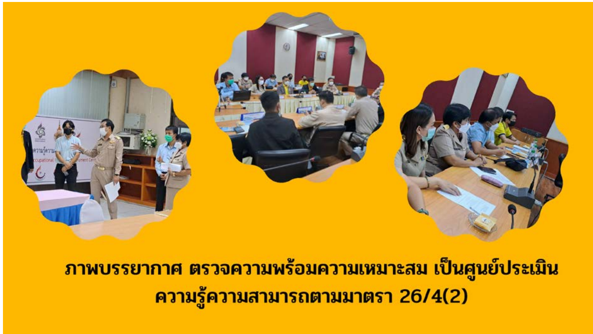
ภาพบรรยากาศ ตรวจสอบความพร้อมความเหมาะสม เป็นศูนย์ประเมิน ความรู้ความสามารถตามมาตรา 26/4(2)