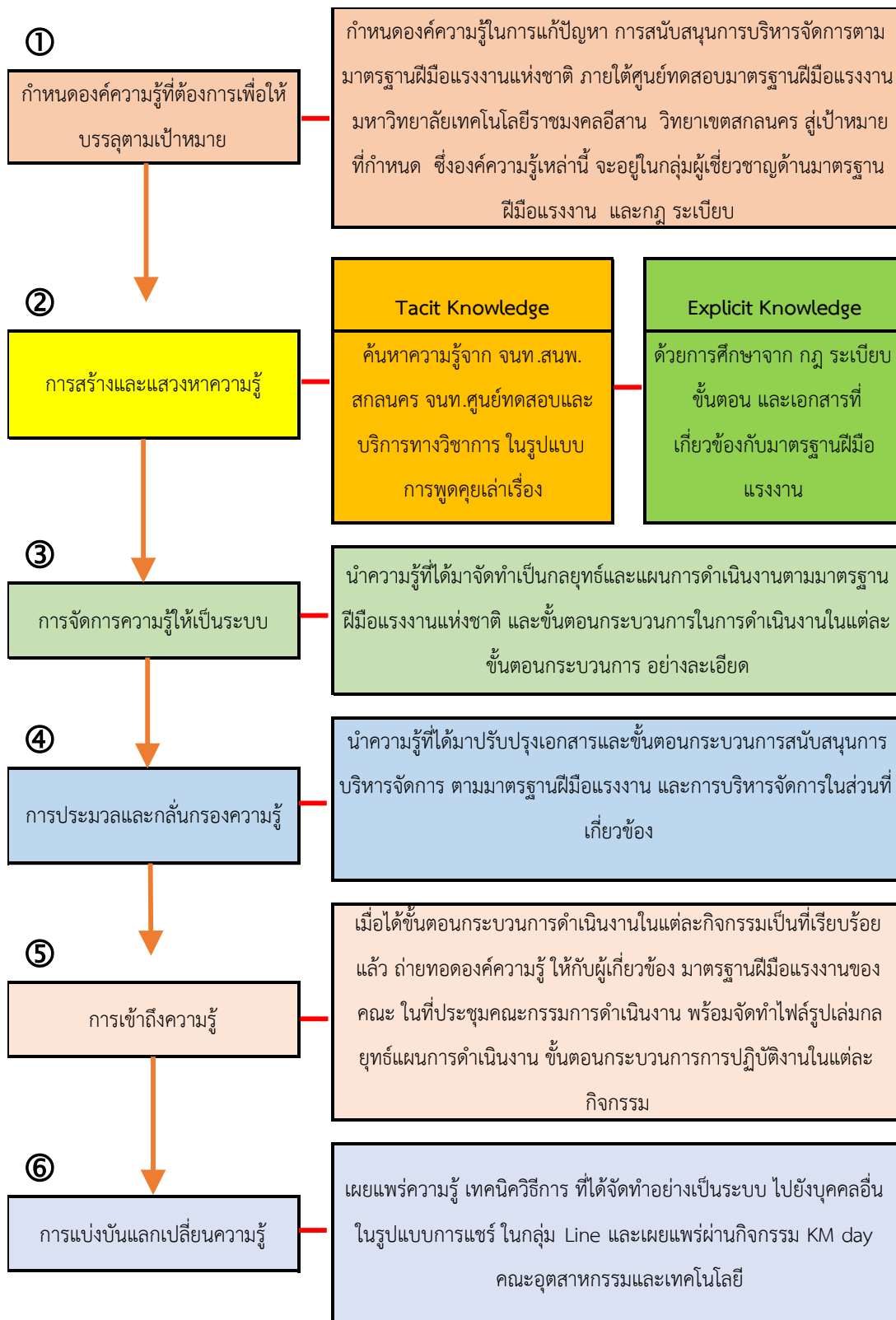
ภาพประกอบที่ 1 วิธีการ กระบวนการหรือขั้นตอน และเครื่องมือการจัดการความรู้