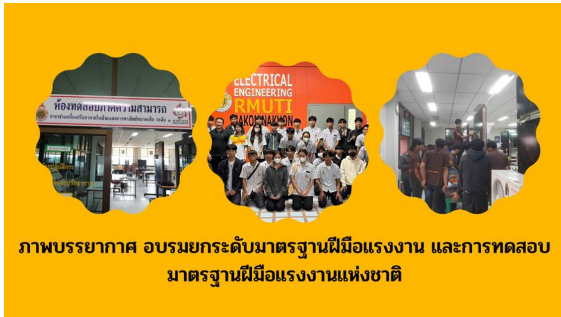
ภาพประกอบที่ 5 การทดสอบมาตรฐานฝีมือแรงงานแห่งชาติที่ได้รับอนุญาต